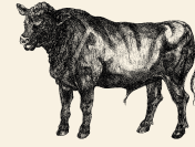
Aberdeen Angus Nötkött