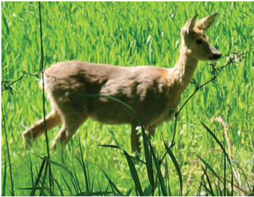
Rådjuret - trädgårdarnas fiende nummer 1.

I våra bostäder och uthus förstör mössen och andra gnagare för stora summor året om.