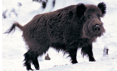
Vildsvinet - en levande jordfräs.

Nämnas bör även viltolyckorna i trafiken; ett allvarligt problem, som årligen kostar samhället enorma summor och samtidigt orsakar mycket personligt lidande.